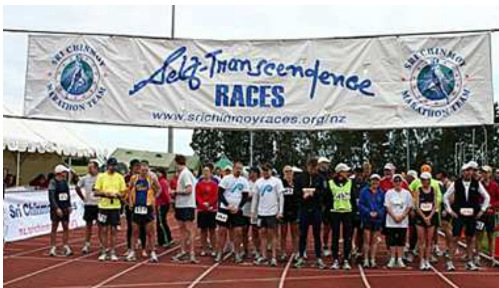
Start van de 24hrs/100 mijl run/racewalk

Vorbereiding. De volgende morgen krijgen we van de luchthavenautoriteiten te horen dat de bagage pas 's avonds zal worden afgeleverd op de afgesproken plaats. We laten het niet aan ons hart komen en gaan naar de supermarkt om de nodige bevoorrading te kopen in functie van de wedstrijd. Dit is ongeveer 2.5 km van de camping en wandelen deze afstand tweemaal om onze stramme spieren terug wat te activeren. De bagage komt aan in de vooravond en kunnen ons eens optimaal verzorgen. 's Anderendaags rijden we naar een volgende camping ongeveer 15 km van het Soeverein Stadium, North City Shore. We trachten vooral de achterstallige slaap te recupereren en rusten voluit.