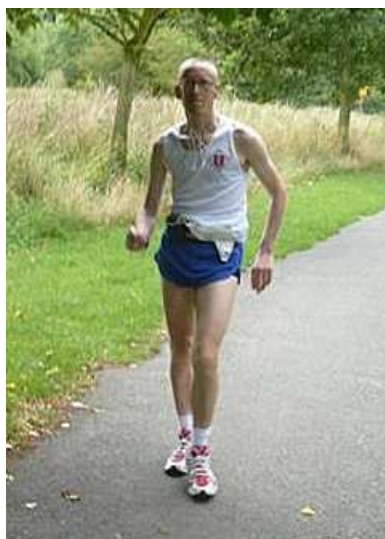
Frank gaat naar de derde plaats