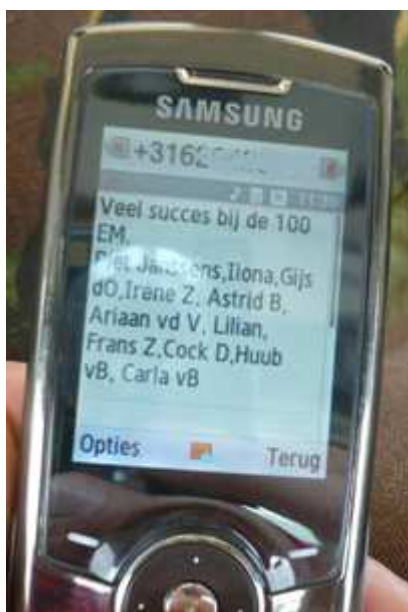
De RWV leeft met je mee