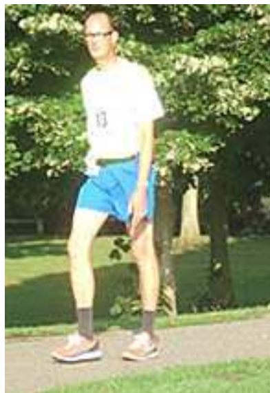
Coert, hoe lang ??