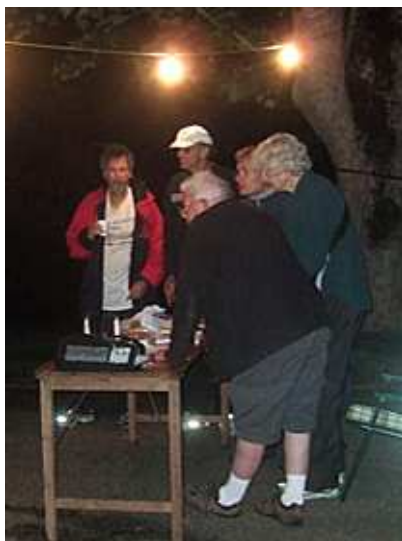
tijdwaarnemers in de nacht